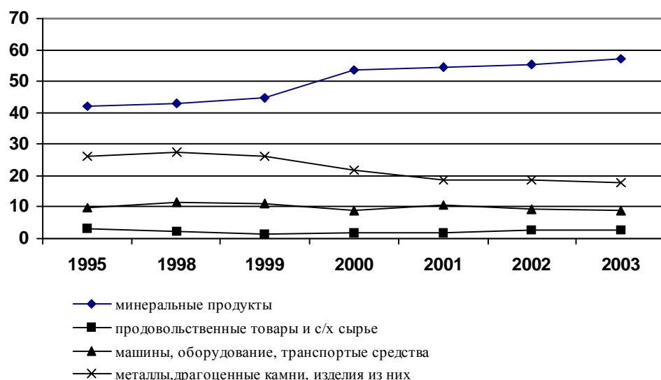
Рис. 1. Динамика экспорта российских товаров

Относительно экспорта продукции машиностроения, заметим, что положение, сложившееся в машиностроении, не дает оснований рассчитывать в