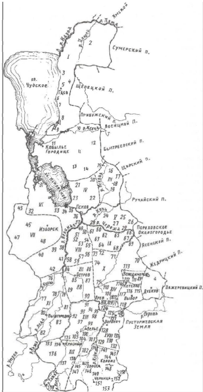
Рис. 3. Псковская земля по материалам писцовой книги 1585-1587 гг. Источник: Янин В. Л. Новгород и Литва: пограничные ситуации XIII-XV веков. М.: Изд-во Моск. ун-та, 1998. С. 134.