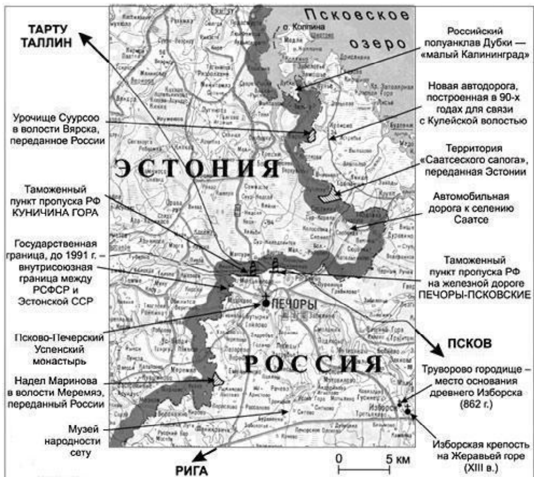
Рис. 1. Предполагаемое изменение российско-эстонской государственной границы (печорский участок)

Совместная российско-эстонская комиссия должна подготовить проекты документов о демаркации госграницы, определит точное положение фарватера на пограничных реках и озерах, а также принадлежность островов на них. После этой работы комиссия установит пограничные знаки, то есть демаркирует границу. В том случае, если будет открыто месторождение полезных ископаемых, находящееся по обе стороны линии разграничения, Россия и Эстония должны стремиться к достижению соглашения относительно методов наиболее эффективной совместной разработ-