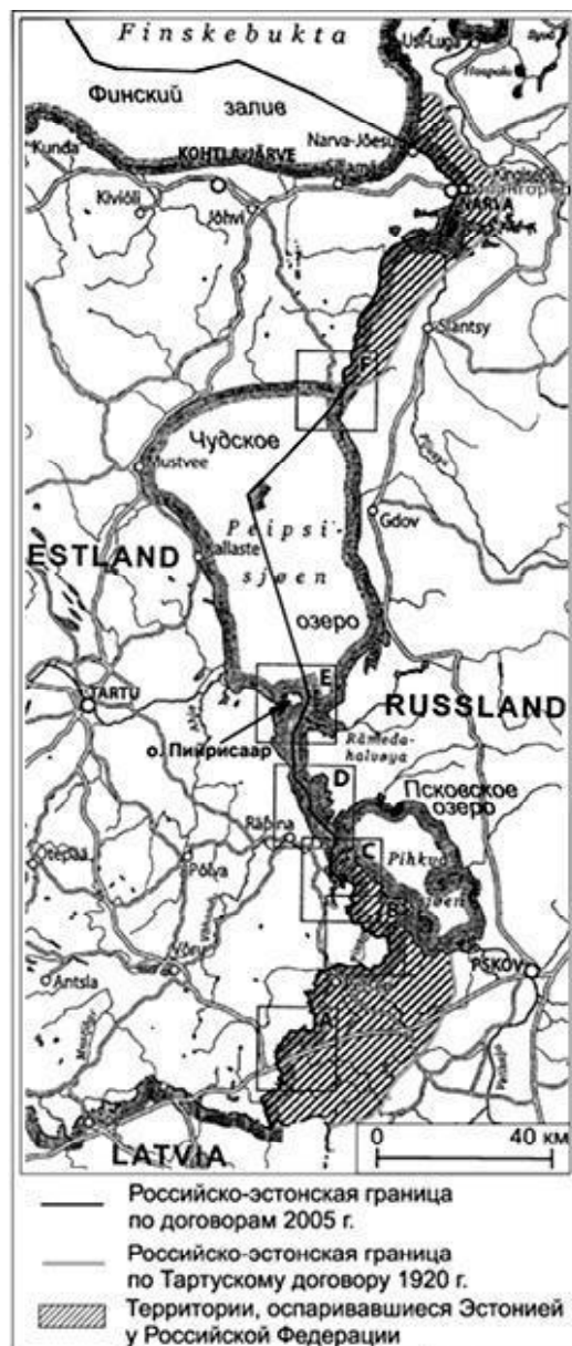
Рис. 2. Соотношение государственных границ Эстонии и России по Тартускому договору 1920 г. и договорам 2005 г.

Насколько соответствует советско-эстонская граница 1920-1930-х гг. более ранним политико-административным, этническим и конфессиональным рубежам? Попробуем разобраться в этом вопросе. Заселение славянами южного и восточного побережий Псковского озера началось предположительно в VI в. На рубеже VII-VIII вв. они основали городище Изборск в 15 км к югу от Псковского