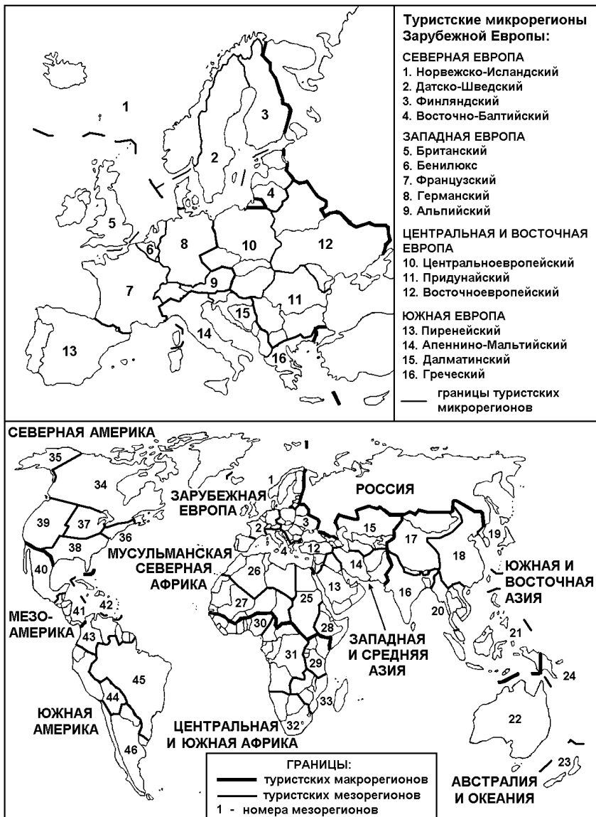
Рис. 8. Туристские регионы мира (с учетом культурной специфики)