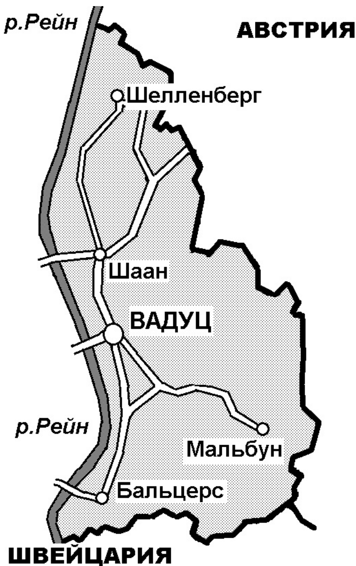
Рис. 12. Княжество Лихтенштейн

и Монако. Однако при этом Лихтенштейн смог бы более чем двукратно уложиться в пределах Вены — столицы соседней Австрии.