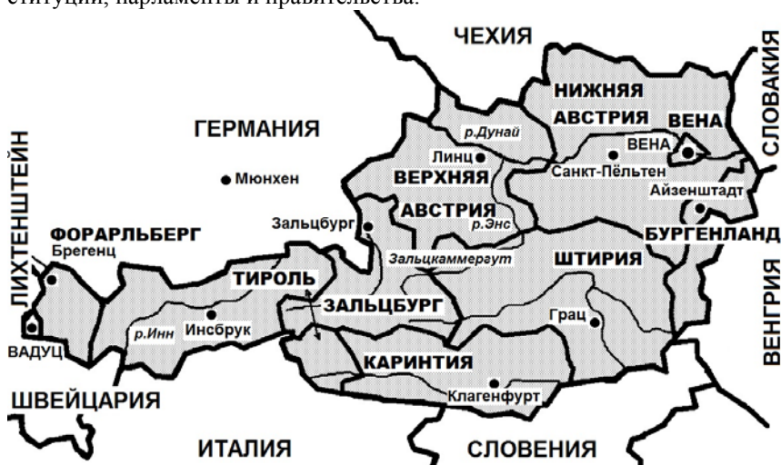
Рис. 11. Федеральные земли Австрии

Государство делится на 9 федеральных земель, имеющих свои конституции, парламенты и правительства.