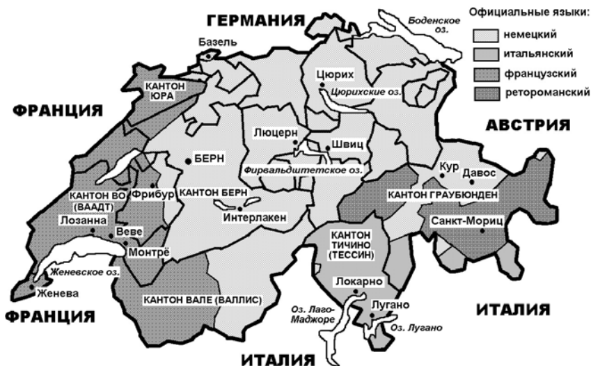
Рис. 13. Официальные языки и основные кантоны Швейцарии

Ретороманцы (50 тыс.) населяют часть юго-восточного кантона Граубюнден , преимущественно германоязычного. Выделяют две народности ретороманцев: романши (в верховьях Рейна) и лдины (в верховьях реки Инн или Эн, притоке Дуная). В Швейцарии остро стоит ретороманская проблема, связанная с постепенным исчезновением ретороманского языка, а вместе с ним, и малочисленного романоязычного народа.